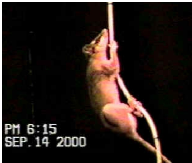
Figura 3: O marsupial Metachirus nudicaudatus no teste de desempenho relativo ao suporte vertical.

Habilidade de transpor descontinuidades entre suportes: São utilizados dois suportes de mesmo diâmetro (2 polegadas), um na horizontal e o outro em um ângulo de aproximadamente 60^\circ . A distância entre eles é flexível, e o animal é estimulado a saltar distâncias cada vez maiores entre esses suportes, partindo de uma distância inicial de comprimento similar ao comprimento do corpo do animal (VIEIRA, 1995; VIEIRA, no prelo). As soluções possíveis encontradas pelos animais incluem numerosos padrões de salto.