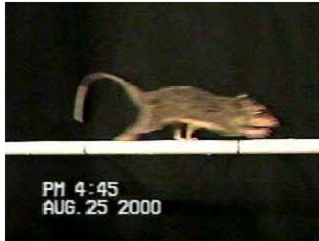
Figura 4: A espécie Philander frenata em um teste de desempenho.

A metodologia descrita acima foi aplicada por VIEIRA (1995), em indivíduos adultos da cuíca cinza da Mata Atlântica, Philander frenata (Olfers, 1818) (PATTON, 1997) (Figura 4). Esses indivíduos foram capturados e mantidos em cativeiro para aclimação, e submetidos à testes de desempenho locomotor sobre superfícies horizontais, já descritos anteriormente.