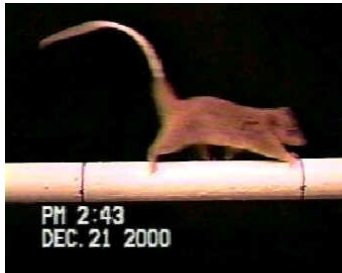
Figura 2: O marsupial Caluromys philander no teste de desempenho relativo ao suporte horizontal.

Locomoção sobre suportes ou superfícies horizontais: simulam o andar arborícola ("arboreal walking") sobre galhos (MARTIN, 1990; VIEIRA, 1995, VIEIRA, no prelo), variando apenas o diâmetro dos suportes e padronizando a rugosidade, textura da superfície e inclinação dos suportes. Quatro diâmetros diferentes são utilizados, variando de 1 a 4 polegadas. Os suportes são fixados na horizontal e o animal é estimulado a correr de uma extremidade a outra (VIEIRA, 1995; VIEIRA, no prelo; Figura 2).