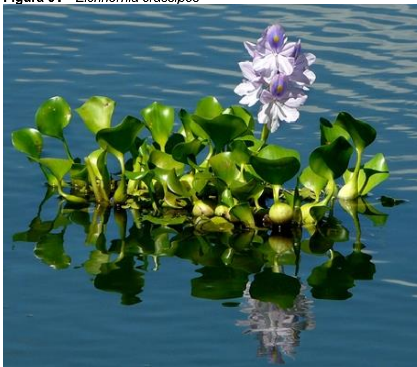
Figura 01 - Eichhornia crassipes

A planta foi coletada no dia 11 de junho de 2018 aproximadamente às 8 horas do período matutino em uma lagoa natural do município de Coxim, MS, coletou-se as plantas adultas da amostra e as mesmas foram introduzidas ao sistema na data equivalente, a macrófita está disposta na Figura 01.