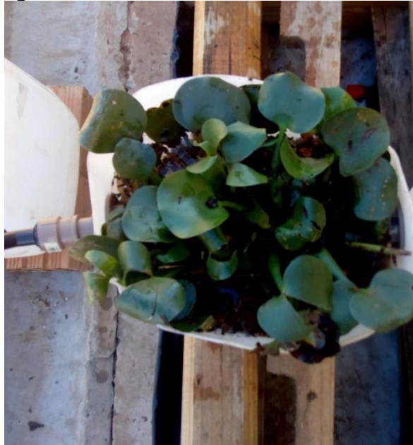
Figura 06 - Galão de número 3