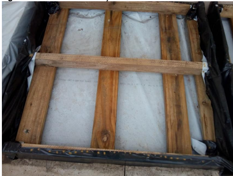
Figura 02 - Bacia de contenção

em sua parte superior para não haver vazamento pelos buracos dos mesmos, a bacia de contenção está representada na Figura 02.