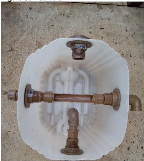
Figura 05 - Galão 02

No galão de número 3, caixa de inspeção abriram-se dois cortes a 18cm de altura, um para o recebimento do efluente advindo do galão 2 por meio de um pedaço de cano de 3cm entre os adaptadores flange e um para a saída do efluente, nesta instalou-se uma torneira e uma mangueira para escoamento do efluente. Acrescentou-se ainda neste galão a espécie fitorremediante para terminar o processo de descontaminação do efluente conforme representa a (Figura 06), o efluente tratado saí pela torneira fixada no galão de número 3 na parede oposta à de recebimento do efluente.