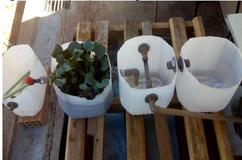
Figura 08 - Protótipo separador de água e óleo construído