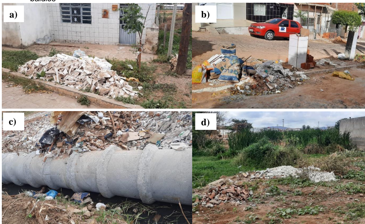
Figura 3 - a) e b) RCD depositados nos logradouros do Bairro Alto Bom Jesus, c) RCD depositados em terrenos para serem possivelmente utilizados como aterro e d) RCD descartados em terrenos baldios