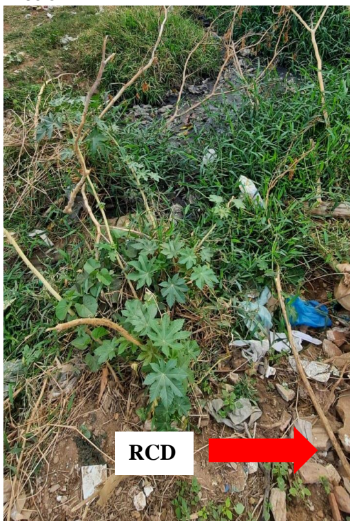
Figura 5 - Lançamento de esgoto domiciliar e RCD no solo

Outro problema observado foi o lançamento de esgoto domiciliar no solo, devido à falta de infraestrutura para captação e destinação adequada no mesmo local onde também é descartado RCD, ver Figura 5.