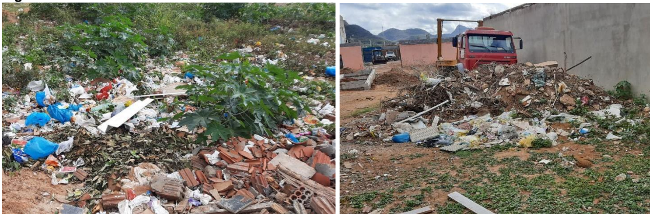
Figura 4 - RSU no mesmo local do RCD