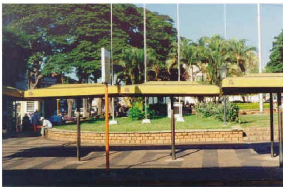
Figura 4. Praça Dr. Aimone Salerno, Taquaritinga, SP.