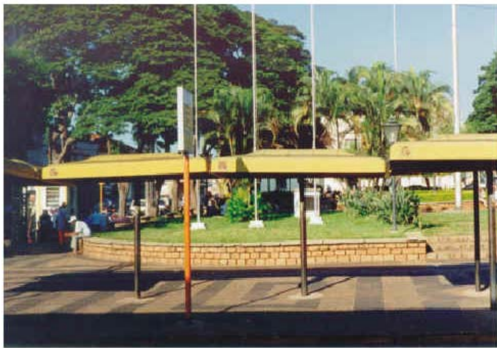
Figura 1. Praça Nove de Julho, Jaboticabal, SP.

Acima: em 1935, então Praça do Centenário.