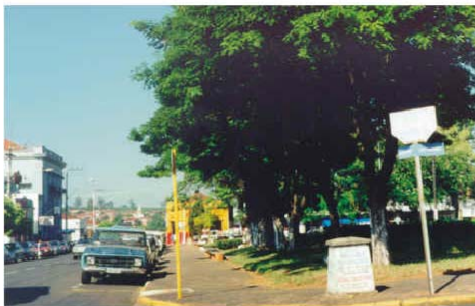
Figura 3. Praça do Centenário, Taquaritinga, SP.

Acima: na década de 30.