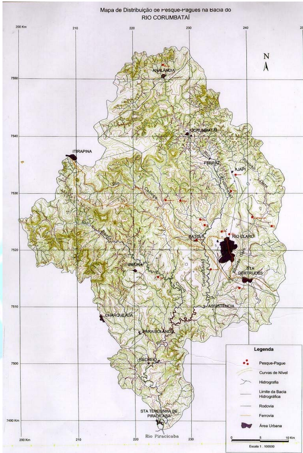
FIGURA 1. Mapa de localização dos pesque-pague na bacia do rio Corumbataí, SP.

Para as análises de clorofila a, as amostras foram acondicionadas em frascos de polietileno, com tampa, limpos com solução sulfocrômica e ácido clorídrico a 10%. A análise foi realizada com a técnica espectrofotométrica colorimétrica. A amostra possui a mistura de clorofila e seus produtos de decomposição (feofitina, feoforbidos), carotenos e xantofilas, assim como pigmentos fotossintéticos de bactérias, folhas mortas, etc. A medição dessa variável foi realizada após extração com etanol, e calculada com seguinte fórmula: